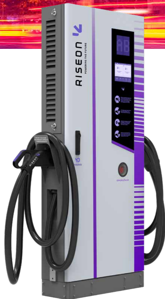
MODELO DC 60kW/80kW