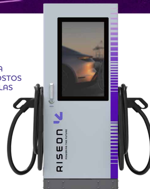
MODELO DC 60kW/80kW