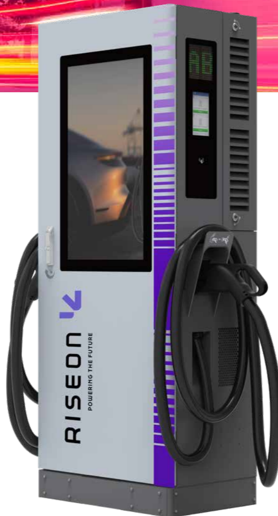
MODELO DC 60kW/80kW