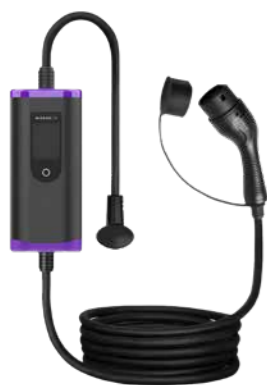
MODELO AC PORTÁTIL 7kW/22kW