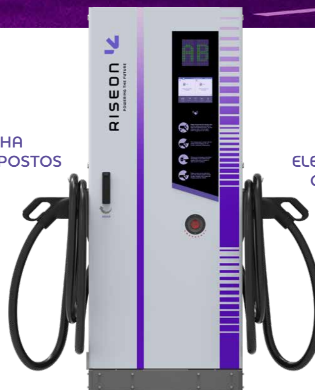
MODELO DC 60kW/80kW/120kW/160kW/180kW/240kW