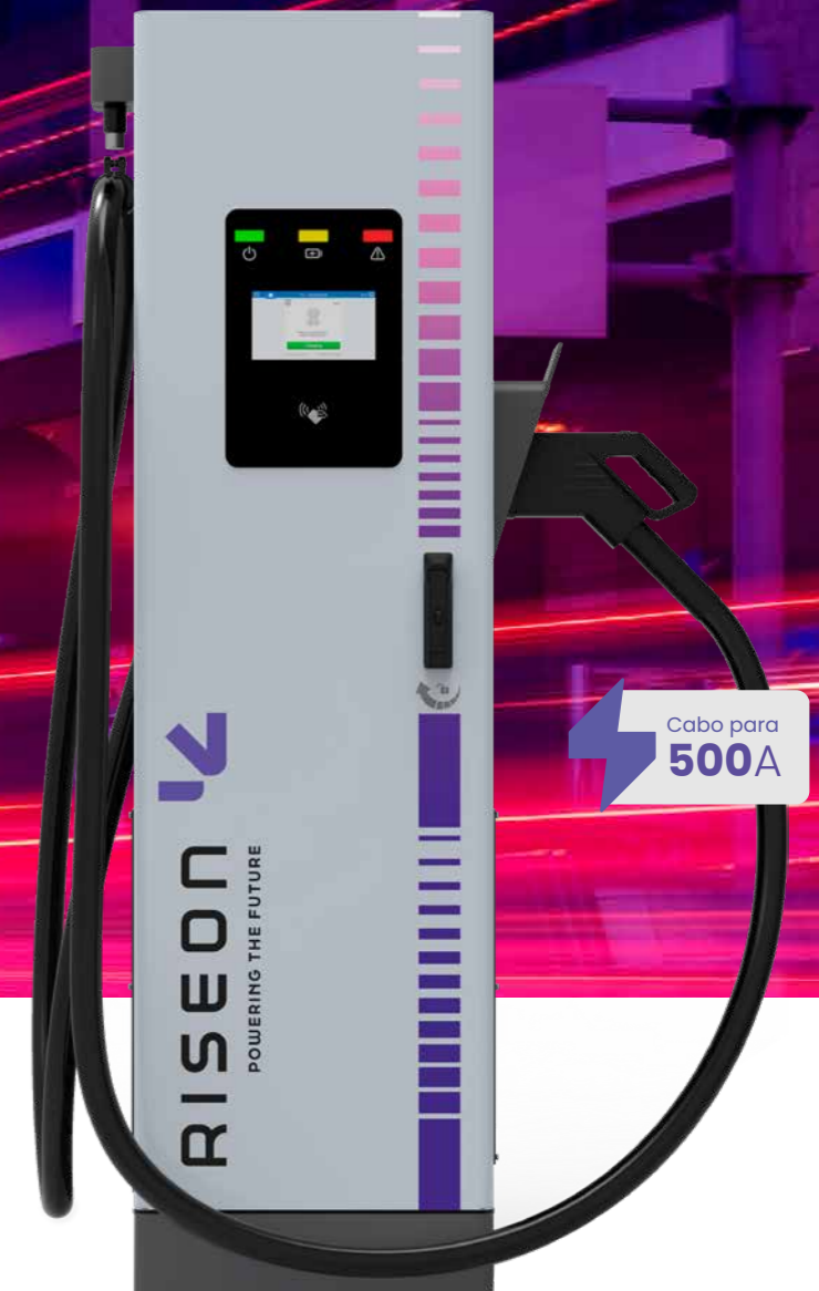
RISE LIGHTSPEED HYDROCOOLING