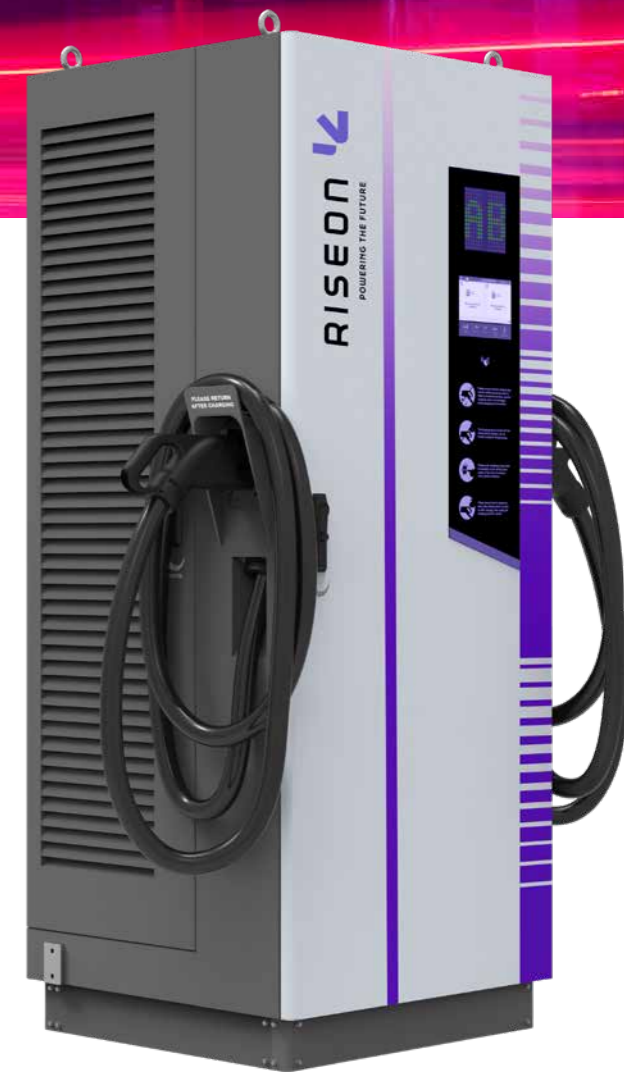
MODELO DC 180kW/240kW