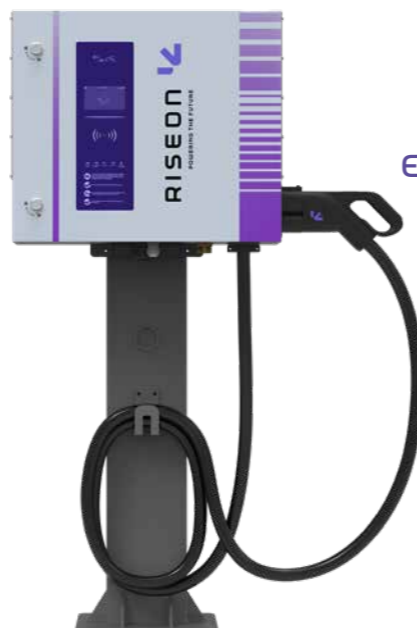
MODELO DC 30kW/40kW