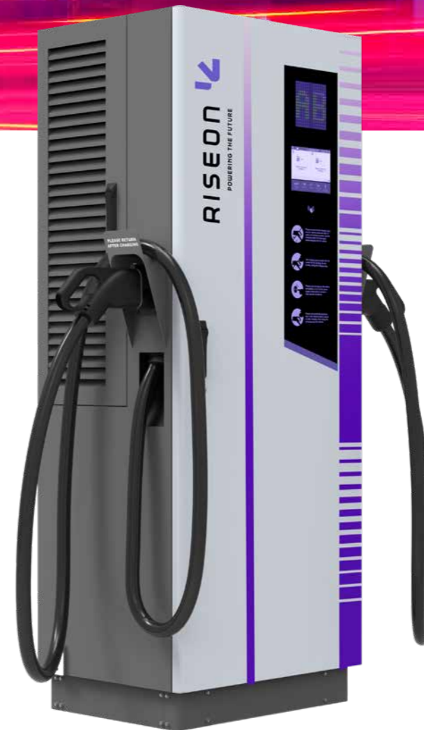
MODELO DC 80kW/120kW/160kW