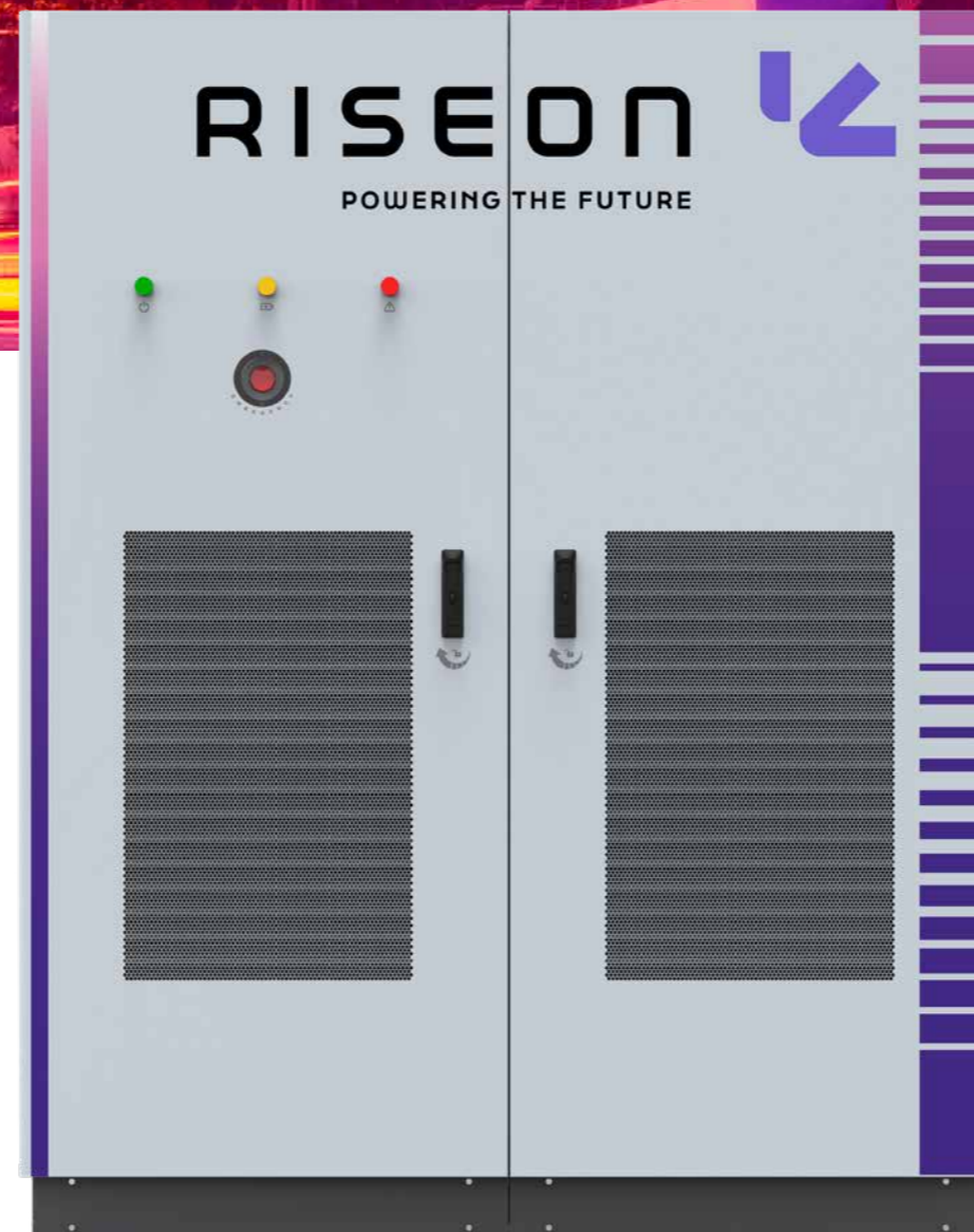
MODELO DC 360kW/480kW