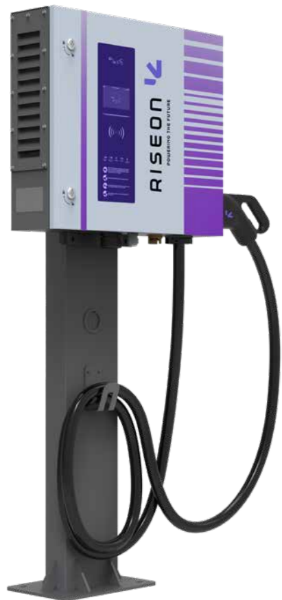
MODELO DC 30kW/40kW